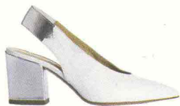
Borsa in eco pelle: PRIMADONNA COLLECTION, 35,99 euro. Décolletées bianco e argento: GIOVANNI FABIANI, 279 euro.