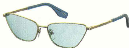
Gli occhiali celesti riprendono la riga del tailleur finestrato: MARC JACOBS, 140 euro.