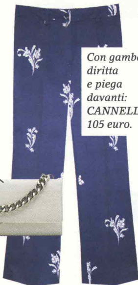
Con gamba diritta e piega davanti: CANNELLA, 105 euro.