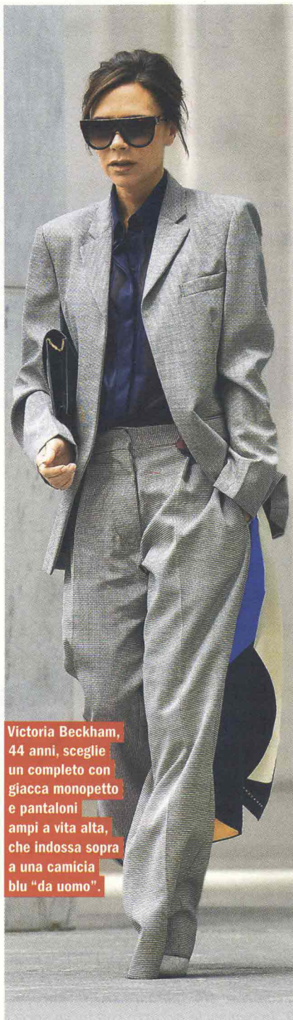
Victoria Beckham, 44 anni, sceglie un completo con giacca monopetto e pantaloni ampi a vita alta, che indossa sopra a una camicia blu "da uomo".