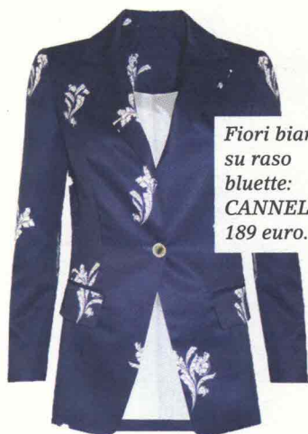
Fiori bianchi su raso bluette: CANNELLA, 189 euro.