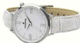
È bianco, come gli altri accessori "glam", l'orologio con cinturino stampa cocco: HOOPS, 60 euro.